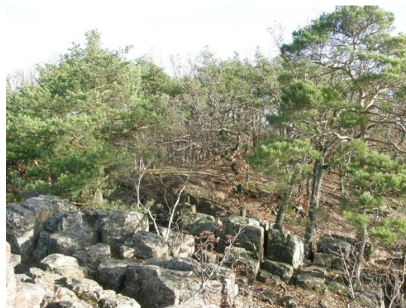
Skalnatý turisticky oblíbený vrchol Květnice - Velká skála.