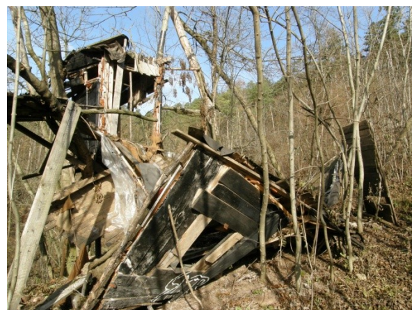
Neodklizené ruiny dřevěného objektu v jižní části přírodní památky.