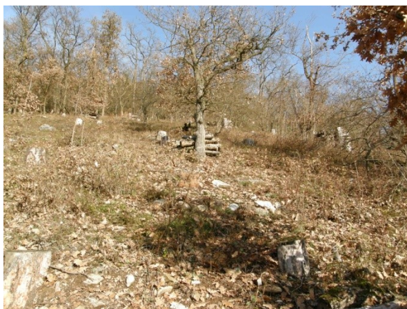
Slunná strán s vegetací lesostepního charakteru s ukázkou nevhodného skladování dřeva.