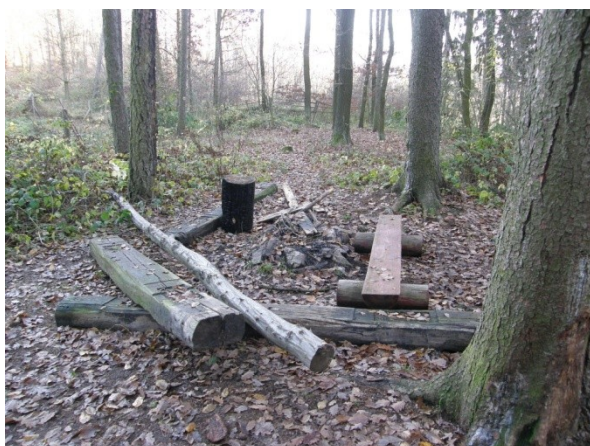
Ohniště se nachází v chráněném území.