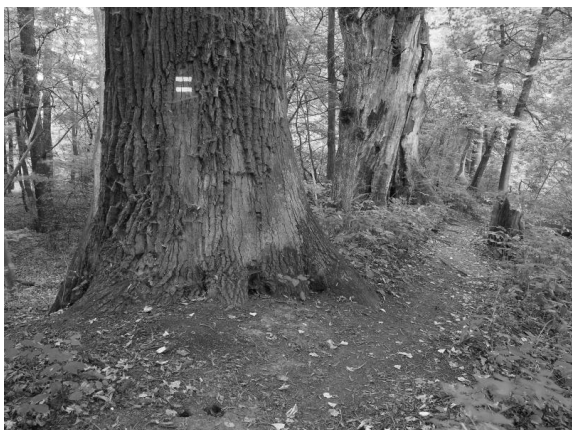
Obr. 3 – úzká nezpevněná stezka pro pěší a současně cyklotrasa vede přímo pod staletými rozpadajícími se duby na koruně zemního valu nad tokem Struhy