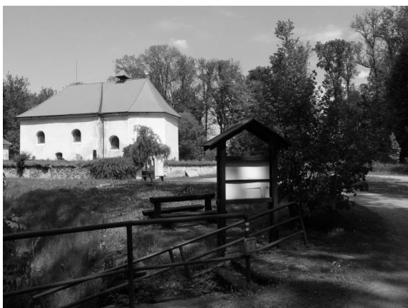
Obr. 5 – Kaple sv. Michala na místě zaniklé vesnice Lepějovice v srdci uprostřed lesního porostu je rekreačně atraktivním místem s charakteristickým geniem loci