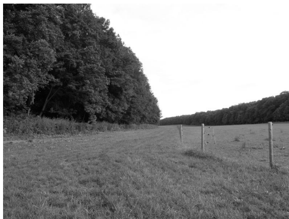
Obr. 4 – Jihovýchodní jezdecká dráha vede těsně podél lesních porostů v přírodní památce. Na snímku není patrná. Zřetelné je vyplocení středového oválu.