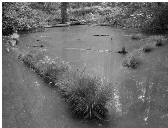
Obr. 6 – Tůň v Lepějovickém lese s rozpadajícími se kmeny porostlými vegetací