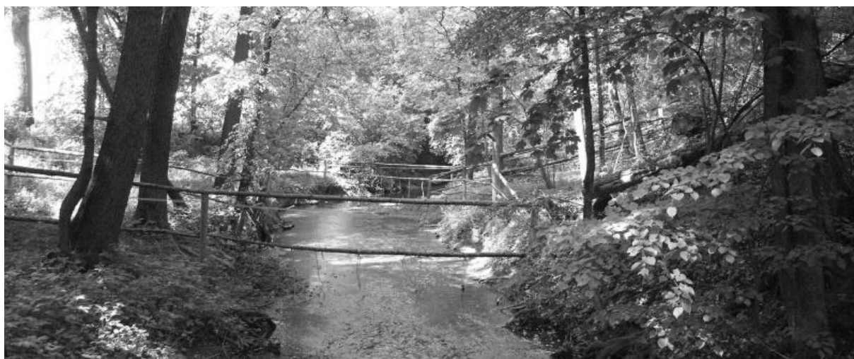
Obr.2 – Ohrazování části toku Struhy a okolních doprovodných porostů

Současné rekreační a sportovní využívání zvláště chráněného území (jezdecký areál, pěší turistika) není třeba zásadně regulovat. Důležité je zachování maximálně stávající intenzity, kdy nedochází k přímému poškozování území (vyjma brodění koní). Zásadním regulačním opatřením je omezení jízdy na kolech po značené turistické stezce, zejména v bezprostřední blízkosti Struhy. Důvodem je zejména bezpečnost návštěvníků, ale i potenciální zvýšení eroze na stezce. Ze stejných důvodů zde není žádoucí ani její jezdecké využívání a samozřejmě jízda motorových vozidel. Proto je vhodné na obou koncích stezky umístit informační tabule s piktogramy upozorňujícími na omezení tohoto rekreačního využívání. Dalším důležitým bodem je diskuze s provozovateli jezdeckého areálu nad nezbytností vytváření ohrad v krajině.