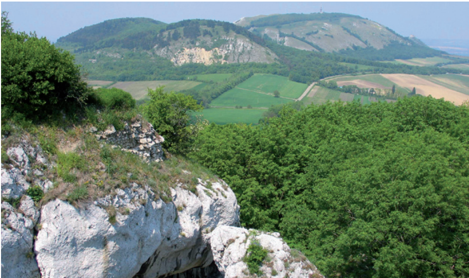
CHKO Pálava byla první oblastí, kde byl plán péče zpracován podle nové metodiky.